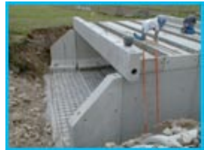
Ouvrage à travée simple