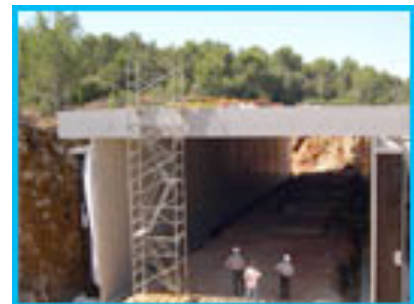
Tramway Montpellier (34)