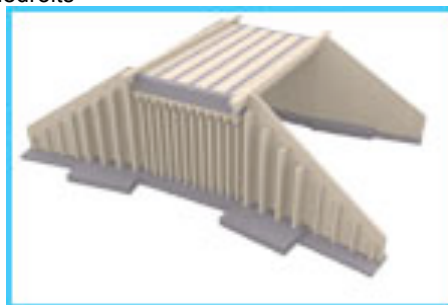
Animation conception PIPO