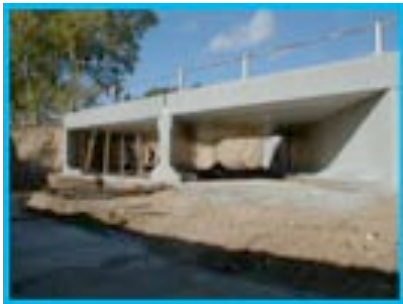
Ouvrage à travées multiples