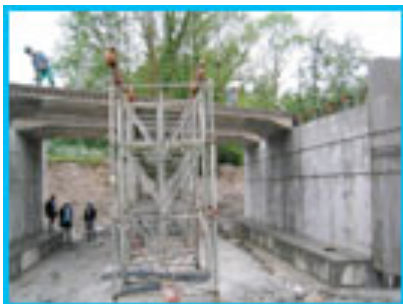
Déviations de Bedous (64)